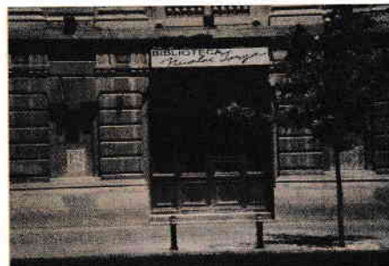
Biblioteca Județeană Nicolae Iorga

( Școala după școală la bibliotecă , www.romania-actualitati.ro , text adaptat)